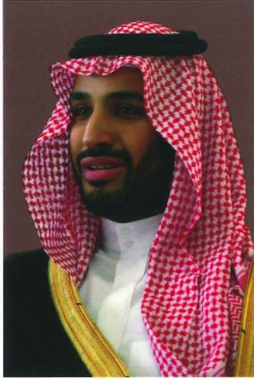
صاحب السمو الملكي الأمير محمد بن سلمان بن عبدالعزيز آل سعود ولي العهد نائب رئيس مجلس الوزراء وزير الدفاع