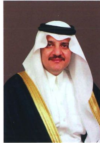
صاحب السمو الملكي الأمير سعود بن نايف بن عبدالعزيز آل سعود أمير المنطقة الشرقية