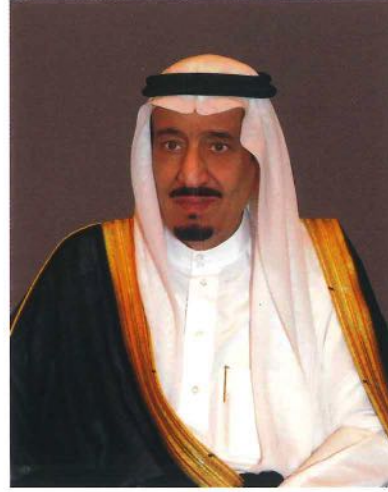
خادم الحرمين الشريفين الملك سلمان بن عبدالعزيز آل سعود