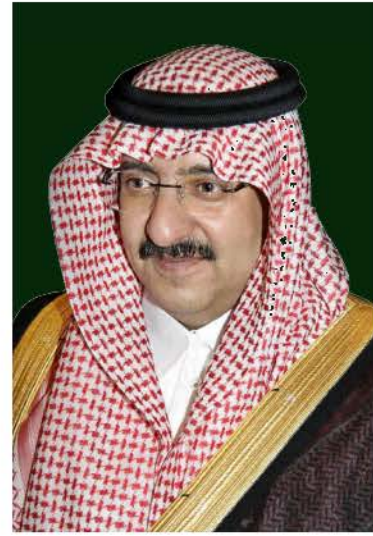
صاحب السمو الملكي الأمير محمد بن نايف بن عبدالعزيز آل سعود ولي العهد نائب رئيس مجلس الوزراء وزير الداخلية