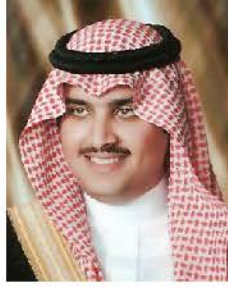
صاحب السمو الملكي الأمير تركي بن محمد بن فهد بن عبد العزيز آل سعود رئيس مجلس الإدارة