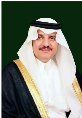
صاحب السمو الملكي الأمير سعود بن نايف بن عبدالعزيز آل سعود أمير المنطقة الشرقية