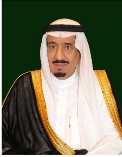
خادم الحرمين الشريفين الملك سلمان بن عبدالعزيز آل سعود