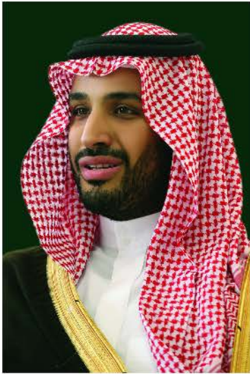
صاحب السمو الملكي الأمير محمد بن سلمان بن عبدالعزيز آل سعود ولي ولي العهد النائب الثاني لرئيس مجلس الوزراء وزير الدفاع