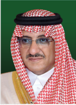
صاحب السمو الملكي الأمير محمد بن نايف بن عبدالعزيز ولي العهد النائب الثاني لمجلس الوزراء وزير الداخلية