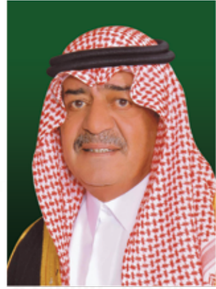
صاحب السمو الملكي الأمير مقرن بن عبدالعزيز آل سعود ولي العهد نائب رئيس مجلس الوزراء