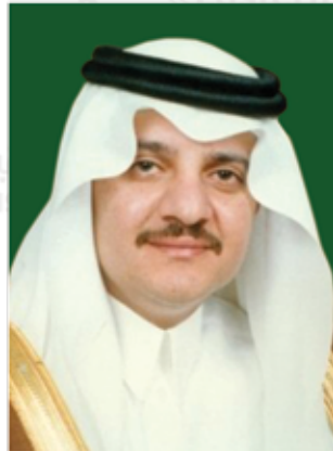
صاحب السمو الملكي الأمير سعود بن نايف بن عبدالعزيز أمير المنطقة الشرقية