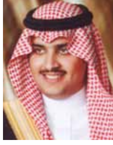
صاحب السمو الملكي الأمير تركي بن محمد بن فهد بن عبدالعزيز آل سعود رئيس مجلس الإدارة