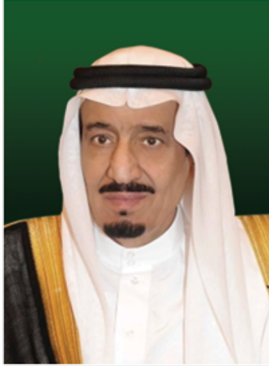
خادم الحرمين الشريفين الملك سلمان بن عبدالعزيز آل سعود ملك المملكة العربية السعودية